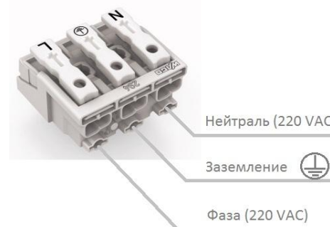
Рисунок 3 Схема подключения светильника